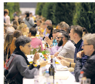
Genießen an der Langen Tafel

Gut, sauber und fair genießen und einkaufen – das geht auf der Slow Food . Ein Highlight ist die Lange Tafel. Hier finden Feinschmeckerinnen und Feinschmecker einen Platz, an dem sie durchatmen, mit Tischnachbarn ins Gespräch kommen und regionale Spezialitäten genießen können.