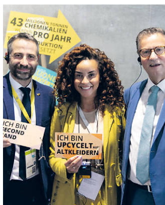
Fair macht den Unterschied

Ohne erhobenen Zeigefinger präsentiert die Fair Handeln