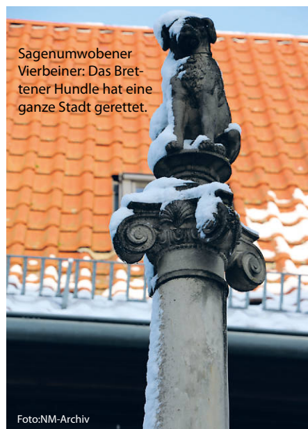
Sagenumwobener Vierbeiner: Das Brettener Hundle hat eine ganze Stadt gerettet.

Und da wäre noch die Geschichte vom Hexenbiss am Heidelberger Schloss, das älteste Musikinstrument der Welt oder auch die Antwort auf die wichtige Frage, warum Badener auch als „Gelbfüßler“ bezeichnet werden. Diese und noch viele andere spannende Anekdoten und Legenden zeigt unsere Rubrik „Unnützes Heimat-Wissen“ auf. (haf)