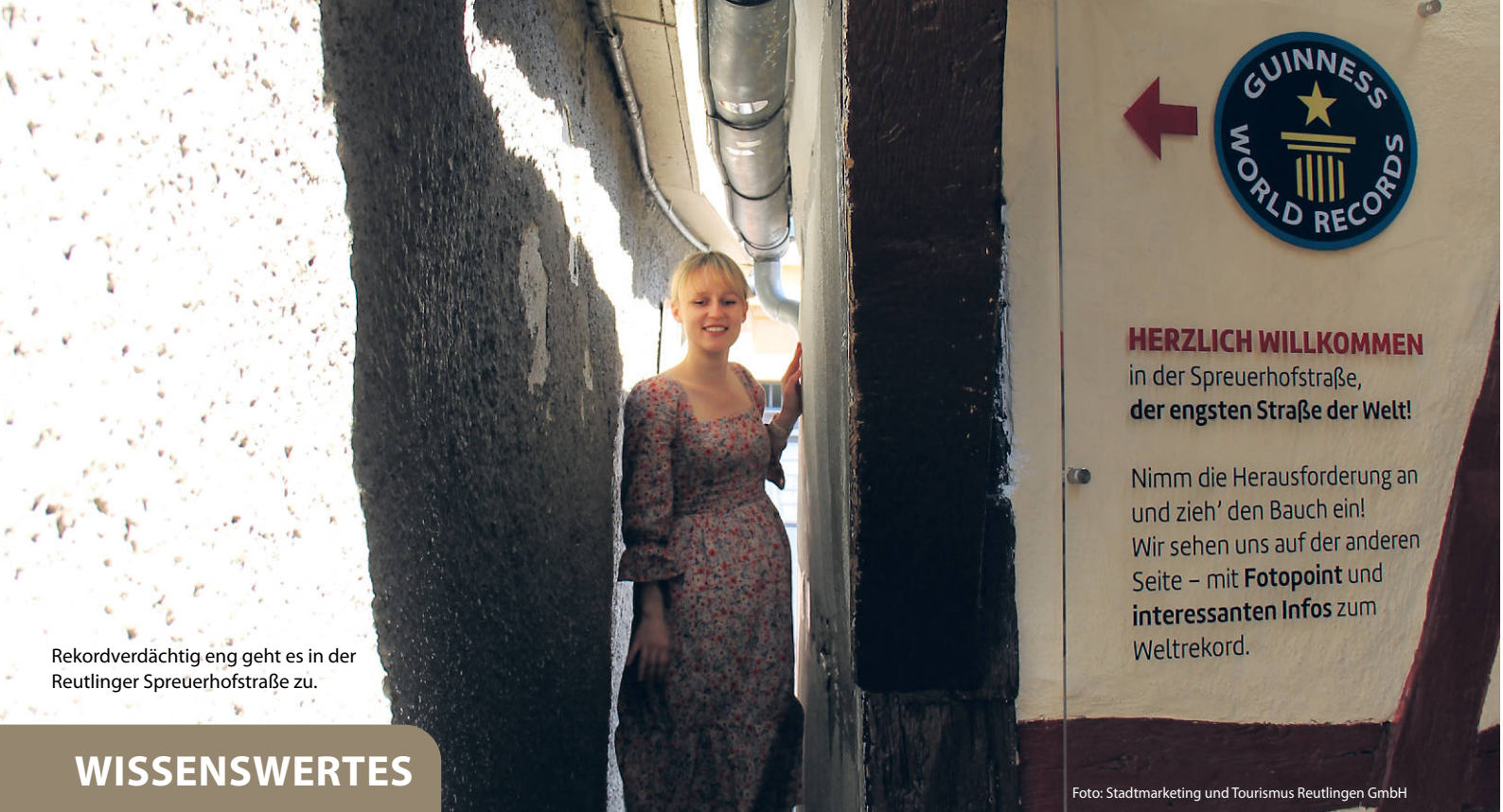
Rekordverdächtig eng geht es in der Reutlinger Spreuerhofstraße zu.