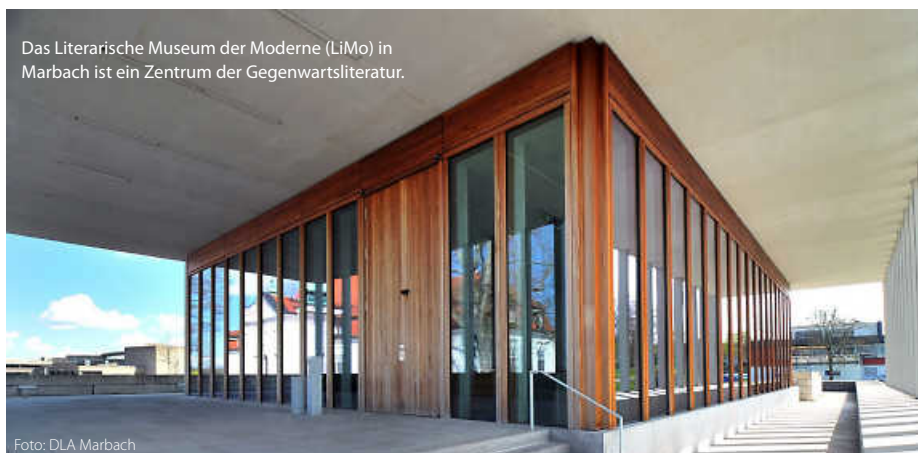
Das Literarische Museum der Moderne (LiMo) in Marbach ist ein Zentrum der Gegenwartsliteratur.

Ob Klassiker oder Bestseller, historische Manuskripte oder Poetry-Slams – Baden-Württemberg zeigt, dass Literatur hier nicht nur geschrieben, sondern gelebt wird. (jr)