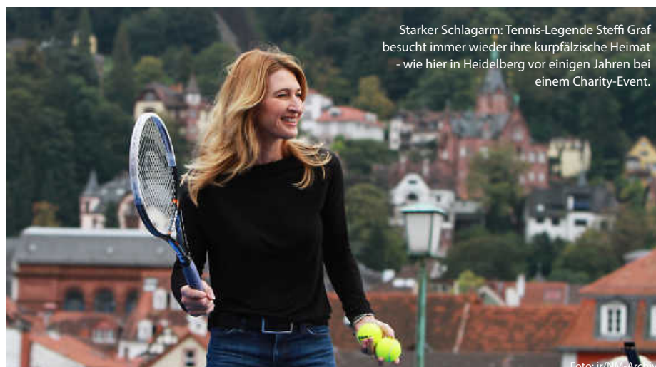
Starker Schlagarm: Tennis-Legende Steffi Graf besucht immer wieder ihre kurpfälzische Heimat – wie hier in Heidelberg vor einigen Jahren bei einem Charity-Event.