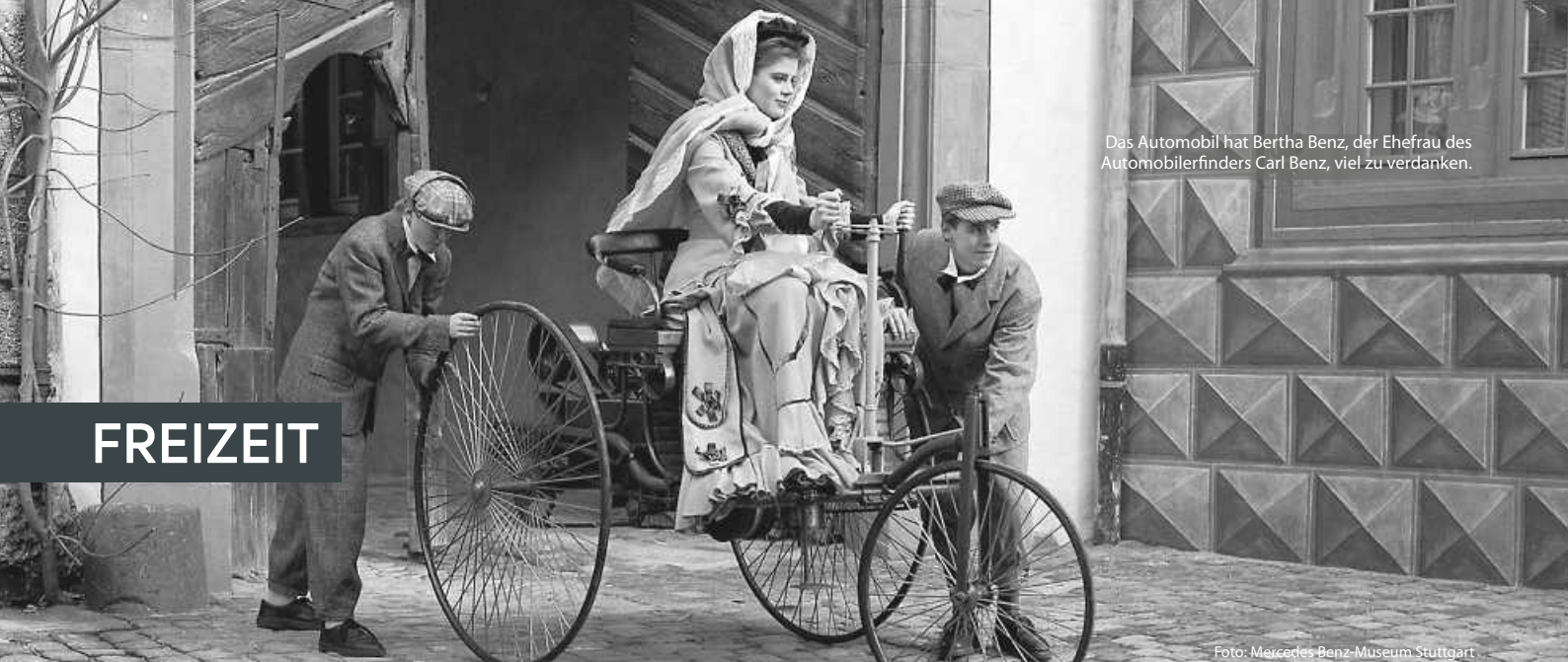
Das Automobil hat Bertha Benz, der Ehefrau des Automobilfinders Carl Benz, viel zu verdanken.