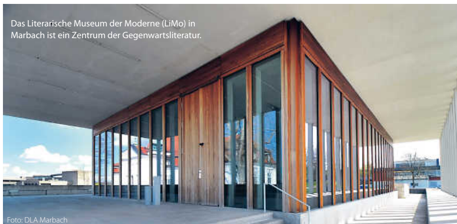
Das Literarische Museum der Moderne (LiMo) in Marbach ist ein Zentrum der Gegenwartsliteratur.

Ob Klassiker oder Bestseller, historische Manuskripte oder Poetry-Slams – Baden-Württemberg zeigt, dass Literatur hier nicht nur geschrieben, sondern gelebt wird. (jr)