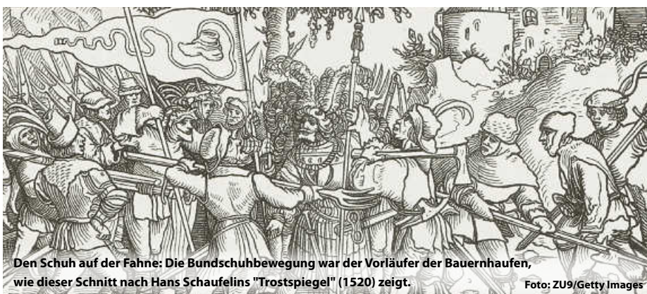
Den Schuh auf der Fahne: Die Bundschuhbewegung war der Vorläufer der Bauernhaufen, wie dieser Schnitt nach Hans Schaufelins "Trostspiegel" (1520) zeigt.

In Baden-Württemberg werden den aufständischen Bauern dieses Jahr etliche Veranstaltungen und Ausstellungen gewidmet. So hat das Landesmuseum Württemberg gleich mehrere große Projekte auf den Weg gebracht: Von der Erlebnisausstellung „Protest!“ in Stuttgart über spektakuläre KI-Projekte („Uffruhr!“) in Bad Schussenried, die auch mobil unterwegs ist oder einer Kinderausstellung („Zoff!“). Doch auch an den historischen Stätten im Kraichgau, Heilbronn oder Böblingen ist zum 500. Jahrestag der Aufstände einiges an Programm geboten. (js)