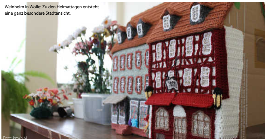
Weinheim in Wolle: Zu den Heimattagen entsteht eine ganz besondere Stadtansicht.

Der Startschuss zu den Heimattagen 2025 fällt am Sonntag, 12. Januar, im Rahmen des Neujahrsempfangs der Stadt Weinheim. Dabei wird Ministerialdirektor Rainer Moser aus dem Landesinnenministerium auch offiziell die Landes-Heimattage-Standarte an OB Manuel Just überreichen. (km/red)