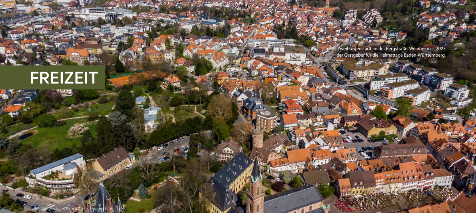
Zweiburgstadt an der Bergstraße: Weinheim ist 2025 der Gastgeber für die Heimattage Baden-Württemberg.