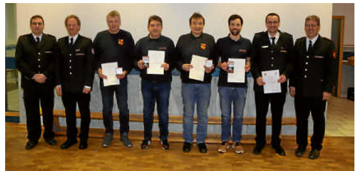
Unser Bild zeigt die geehrten und beförderten Feuerwehrkameraden

Bürgermeister Matousek gab einen Ausblick über die geplanten Beschaffungen und der Kommandant der Werkfeuerwehr Magna, Markus Stang, bedankte sich für die gute Zusammenarbeit. Im nächsten Jahr solle wieder eine gemeinsame Übung stattfinden.