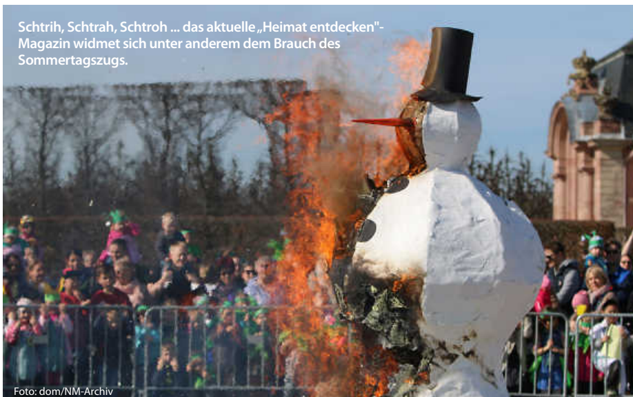
Schtrih, Schtrah, Schtroh ... das aktuelle „Heimat entdecken“-Magazin widmet sich unter anderem dem Brauch des Sommertagszugs.