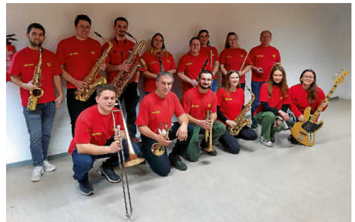
DLRG- Jubiläumsband „Die Quietscheentchen“

Die DLRG Ortsgruppe Osterburken besteht in diesem Jahr seit 50 Jahren. Gefeiert wird dies am Samstag, 23. März um 18.00 Uhr in der Baulandhalle in Osterburken. Der Verein lädt hierzu Mitglieder, Freunde und Förderer der Gruppe herzlich ein. Alle DLRGler erwartet an diesem Abend ein angemessener Festakt mit dem Auftritt unserer Jubiläumsband „Die Quietscheentchen“, aber vor allem auch mit gutem Essen und viel Zeit für Gespräche und Erinnerungen. Um eine Anmeldung über die Webseite unter https://osterburken.dlrg.de wird gebeten.